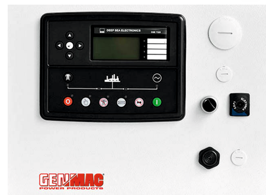
Panou comanda tip QT2A-7320

Protectie IP 65 Temperatura de lucru -30° + 70°C